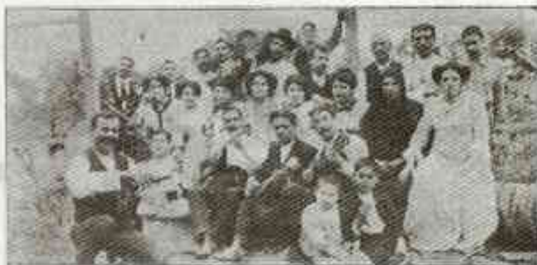
ΚΑΙΡΩΝ — Όμορφες διασκεδάζοντες την δευτέρα ημέραν του Πάσχα. (Απόκ. η κ. Όδ. Αιγιάλας, φωτοκ. κ. Γ. Σπασαράδου)

ΤΟ ΦΥΛΛΟΝ 10 ΛΕΠΤΑ ΓΡΑΦΕΙΑ ΒΛΑΔΟΣ ΕΡΜΟΥ 1 (ΠΛ. ΚΥΡΙΑΚΑΙΩΝ)