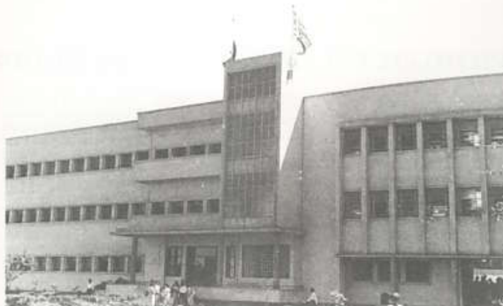
Η Αμπέτειος Σχολή Καΐρου στην περιοχή Ντέρ ελ Μαλάκ.

(Ηπειρωτών, Λημνίων, Καρυστίων, Χιωτών, Φιλόπτωγου, κ.α.), και μετά ..... η μεγάλη στιγμή! Ένα – ένα, ο κ. Κονάς, με αλφαβητική σειρά, φώναζε τα ονόματα των Αποφοίτων της Σχολικής Χρονιάς 1967-1968. Ήταν τα ονόματά μας !!! Περνούσαμε στητοί και κορδωμένοι, αλλά και γρήγορα, για να παραλάβουμε το πολυπόθητο απολυτήριό μας. Σειρά είχε πρώτα το Πρακτικό, μετά το Κλασικό και όπως πάντα τελευταίο ..... το Εμπορικό (αλήθεια γιατί ;).